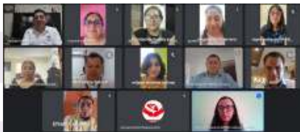
4ª Sesión Ordinaria / 19-04-2024