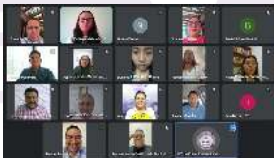
9ª Sesión Ordinaria / 20-09-2024