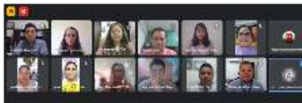
2ª Sesión Ordinaria / 23-02-2024