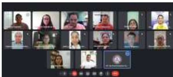
8ª Sesión Ordinaria / 23-08-2024