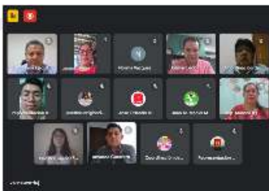
5ª Sesión Ordinaria / 24-05-2024