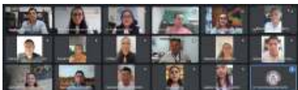
1ª Sesión Ordinaria / 20-01-2024