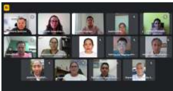
7ª Sesión Ordinaria / 24-07-2024