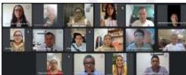
3ª Sesión Ordinaria / 22-03-2024