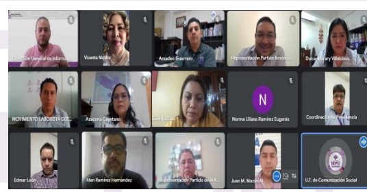
7ª Sesión Ordinaria / 14-07-2023