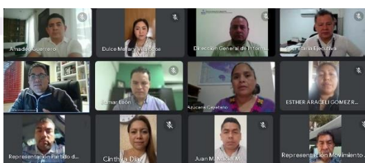
2ª Sesión Ordinaria / 17-02-2023