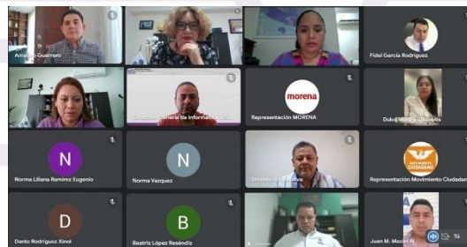
6ª Sesión Ordinaria / 21-06-2023