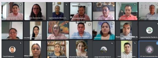
8ª Sesión Ordinaria / 23-08-2023