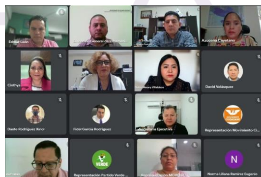
3ª Sesión Ordinaria / 17-03-2023