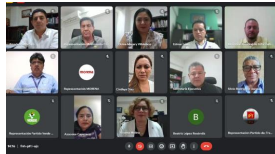
5ª Sesión Ordinaria / 17-05-2023