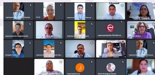
9ª Sesión Ordinaria / 20-09-2023