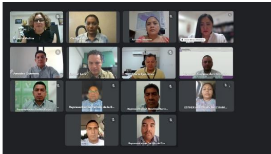
4ª Sesión Ordinaria / 21-04-2023