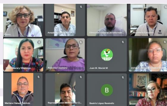
1ª Sesión Ordinaria / 20-01-2023