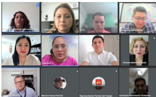
10ª Sesión Ordinaria / 26-10-2022