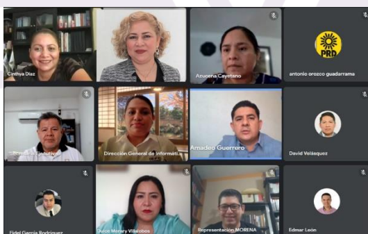
12ª Sesión Ordinaria / 08-12-2022