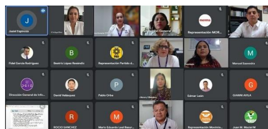
11ª Sesión Ordinaria / 29-11-2022