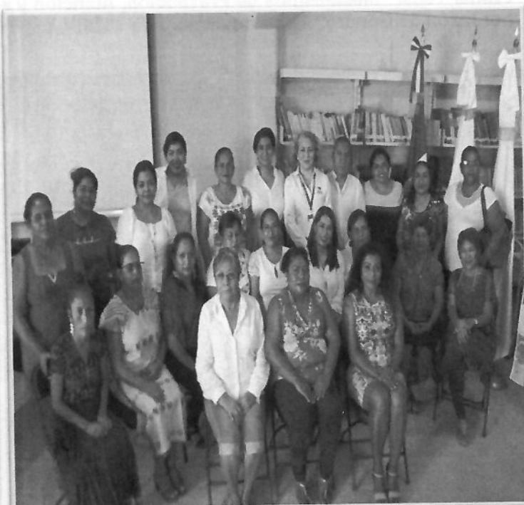
Cuarto Taller “Mecanismos de Prevención, Atención y seguimiento a la Violencia Política contra las Mujeres por razón de Género” 09 de diciembre de 2022.