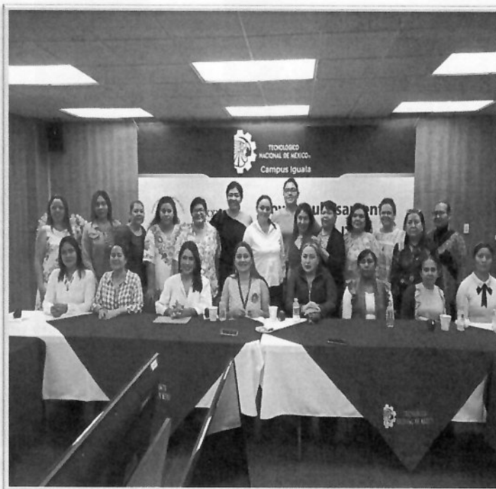
Segundo Taller “Mecanismos de Prevención, Atención y seguimiento a la Violencia Política contra las Mujeres por razón de Género” 02 de diciembre de 2022.