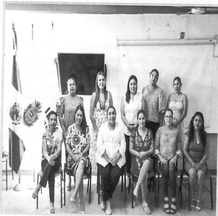
Quinto Taller “Mecanismos de Prevención, Atención y seguimiento a la Violencia Política contra las Mujeres por razón de Género” 10 de diciembre de 2022.

LA PRESIDENTA DE LA COMISIÓN ESPECIAL DE IGUALDAD DE GÉNERO Y NO DISCRIMINACIÓN