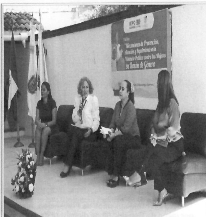
Primer Taller “Mecanismos de Prevención, Atención y seguimiento a la Violencia Política contra las Mujeres por razón de Género” 18 de noviembre de 2022.