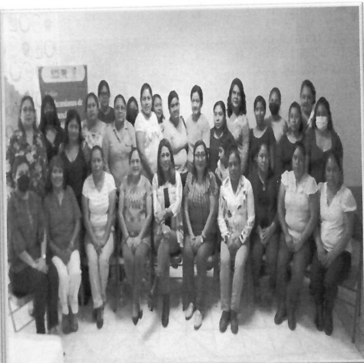
Tercer Taller “Mecanismos de Prevención, Atención y seguimiento a la Violencia Política contra las Mujeres por razón de Género” 03 de diciembre de 2022.