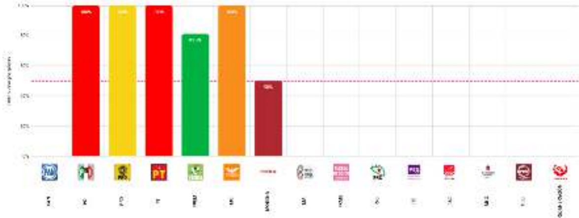
Gráfica 1. Cumplimiento para el cargo de Diputaciones

Esta información se puede consultar en el siguiente portal del Instituto: https://pauta-paritaria.ine.mx/