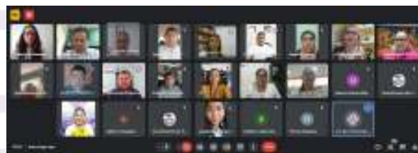
8ª Sesión Ordinaria / 21-08-2024