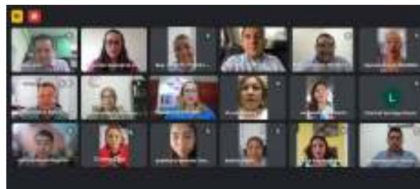
6ª Sesión Ordinaria / 21-06-2024