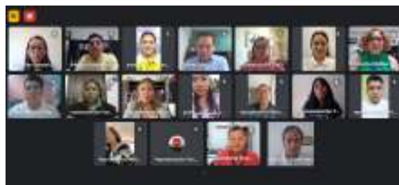
2ª Sesión Ordinaria / 19-02-2024