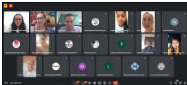
4ª Sesión Extraordinaria / 27-05-2024