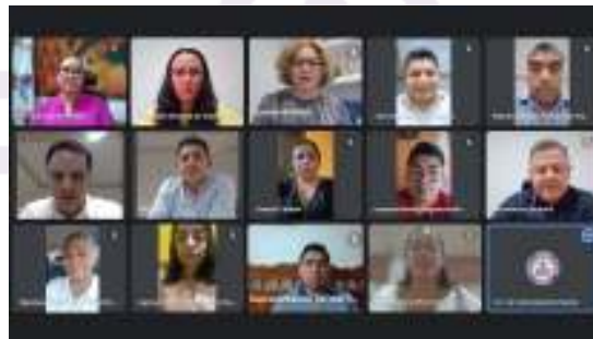
1ª Sesión Ordinaria / 18-01-2024