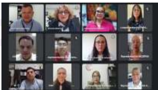
1ª Sesión Extraordinaria / 11-01-2024