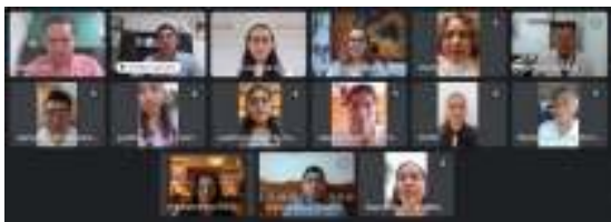
2ª Sesión Extraordinaria / 20-01-2024