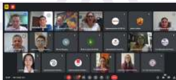
5ª Sesión Ordinaria / 24-05-2024