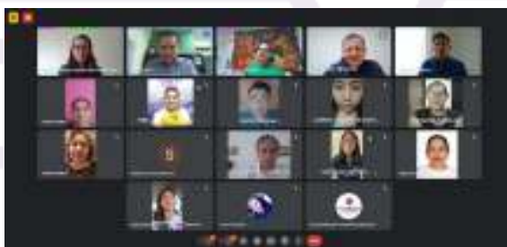
7ª Sesión Ordinaria / 22-07-2024