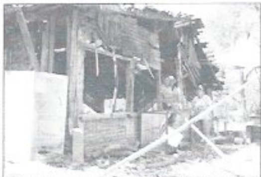
Familia afectada por el sismo en Papantla, Tecpan

Las tres afectadas consideran que se trata de un burla del gobierno en contra de los habitantes damnificados de Papantla, por lo que aseguran que tanto los que viven en esa población como las de las otras localidades afectadas continuarán en la lucha hasta que se les haga justicia.