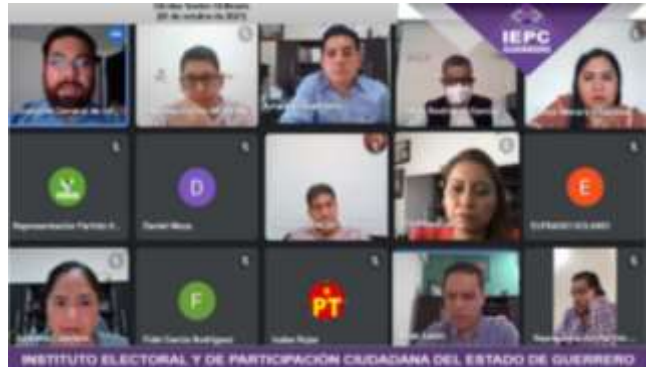
Decima Sesión Ordinaria (20-octubre-2021)