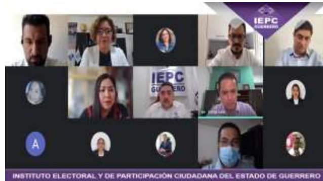
Reunión de trabajo entre las y los Consejeros Electorales y el personal del Centro de Investigación en Computación del Instituto Politécnico Nacional (12-mayo-2021)