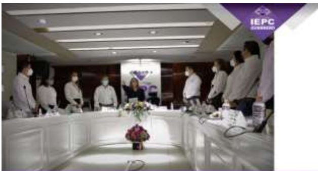
Toma de protesta de la Consejera Presidenta (27-octubre-2021)