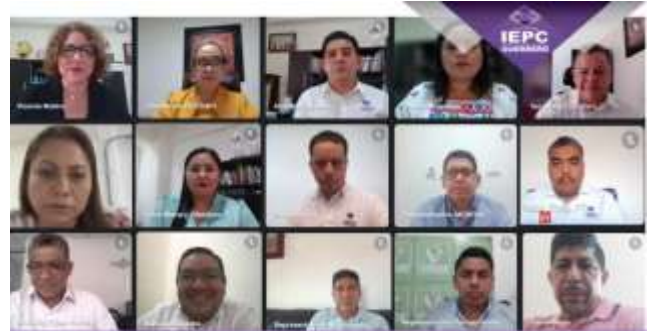
Cuadragésima Quinta Sesión Extraordinaria del Consejo General (09-noviembre-2021)