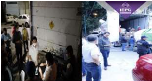
INSTITUTO ELECTORAL Y DE PARTICIPACIÓN CIUDADANA DEL ESTADO DE GUERRERO