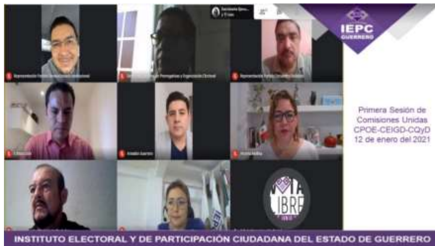
Primera Sesión de Comisiones Unidas CPOE-CEIGD-CQyD 12 de enero del 2021