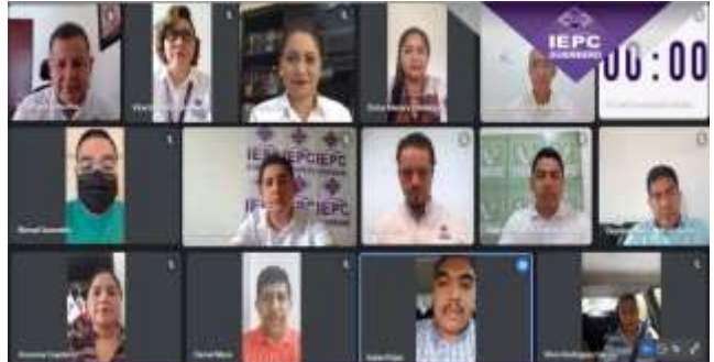
Trigésima Novena Sesión Extraordinaria del Consejo General (07-octubre-2021)