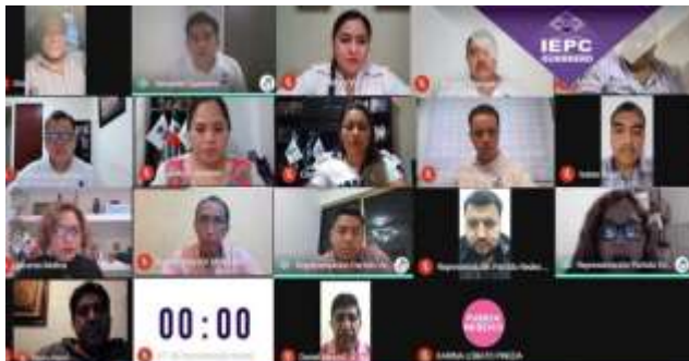
Novena Sesión Ordinaria del Consejo General (29-septiembre-2021)