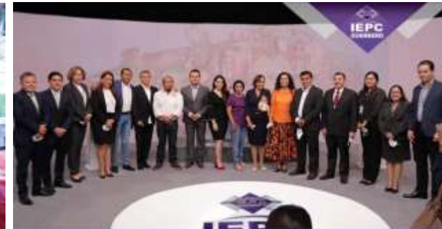
INSTITUTO ELECTORAL Y DE PARTICIPACIÓN CIUDADANA DEL ESTADO DE GUERRERO