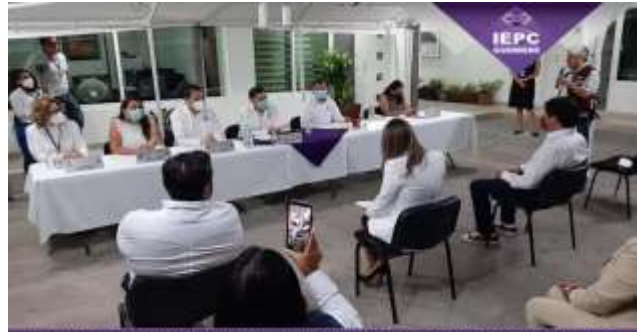
INSTITUTO ELECTORAL Y DE PARTICIPACIÓN CIUDADANA DEL ESTADO DE GUERRERO