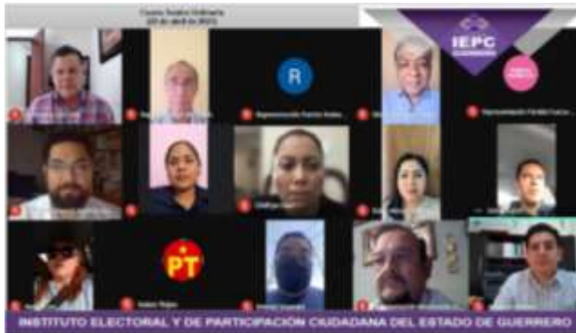
Cuarta Ordinaria (26-abril-2021)