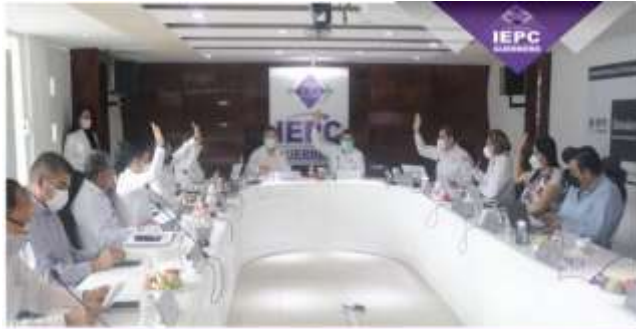
Sesión Permanente de la Jornada Electoral (06-junio-2021)