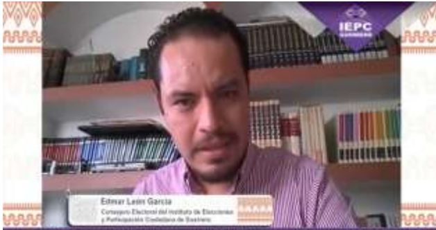
INSTITUTO ELECTORAL Y DE PARTICIPACIÓN CIUDADANA DEL ESTADO DE GUERRERO