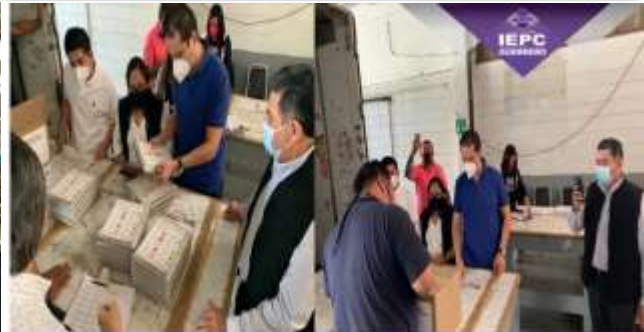
INSTITUTO ELECTORAL Y DE PARTICIPACIÓN CIUDADANA DEL ESTADO DE GUERRERO