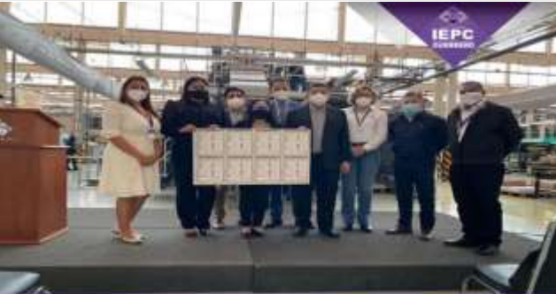
INSTITUTO ELECTORAL Y DE PARTICIPACIÓN CIUDADANA DEL ESTADO DE GUERRERO