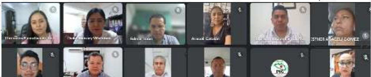
4ª Sesión Extraordinaria de la Comisión de Organización Electoral de fecha 09 de noviembre del 2023