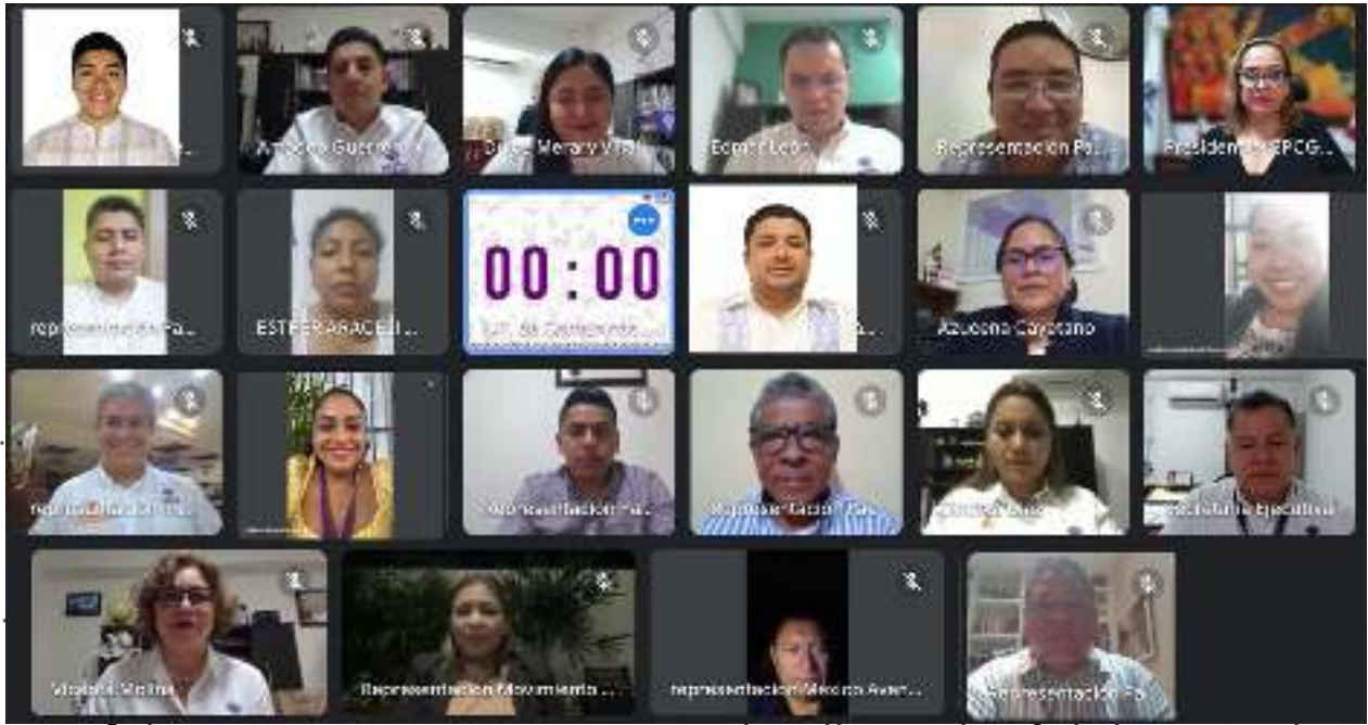
5ª Sesión Extraordinaria de la Comisión de Organización Electoral ampliada de fecha 27 de noviembre del 2023