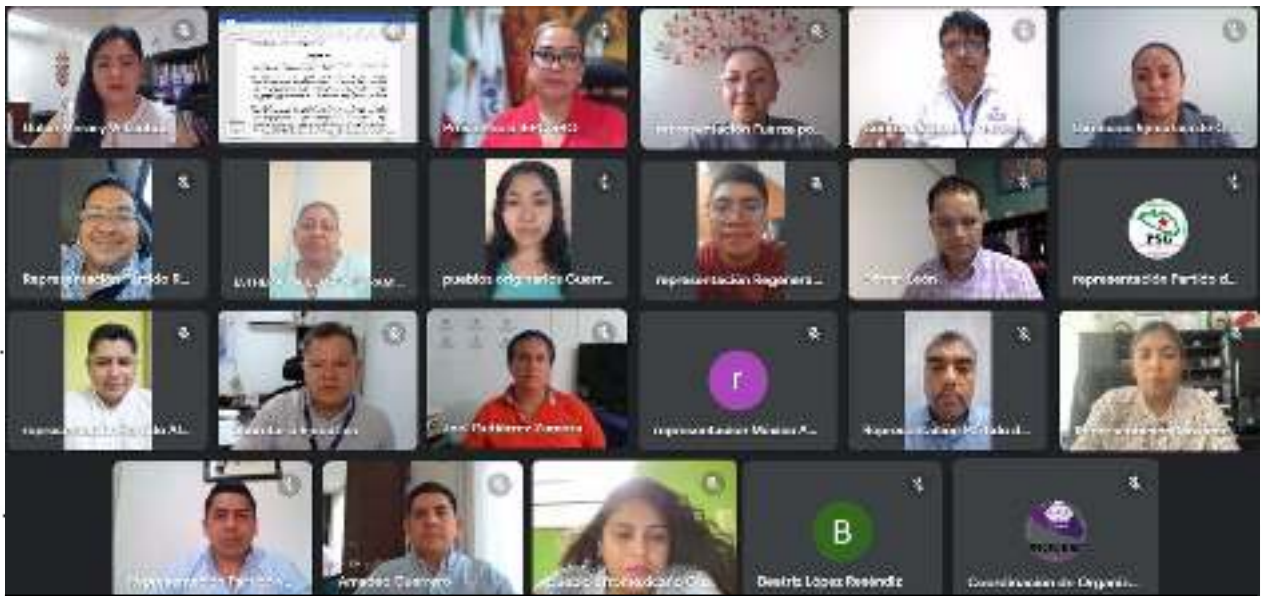
2ª Sesión Extraordinaria de la Comisión de Organización Electoral de fecha 30 de octubre del 2023