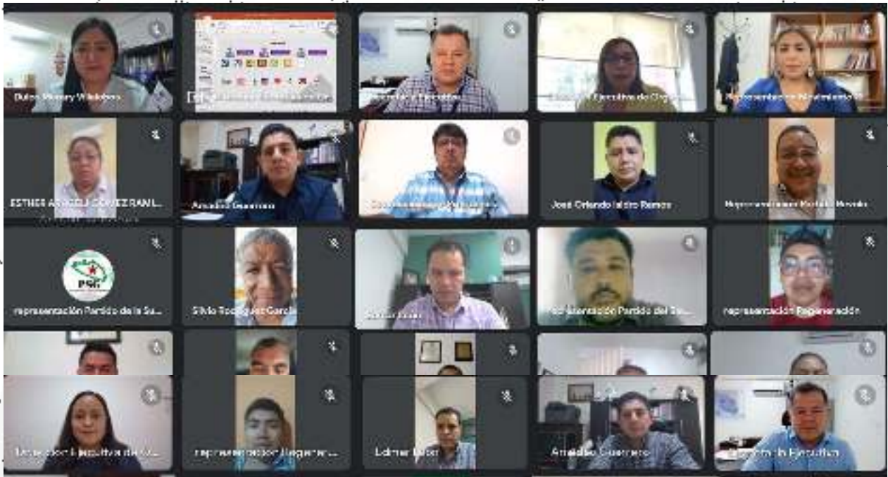
1ª Sesión Ordinaria de la Comisión de Organización Electoral de fecha 29 de agosto del 2023