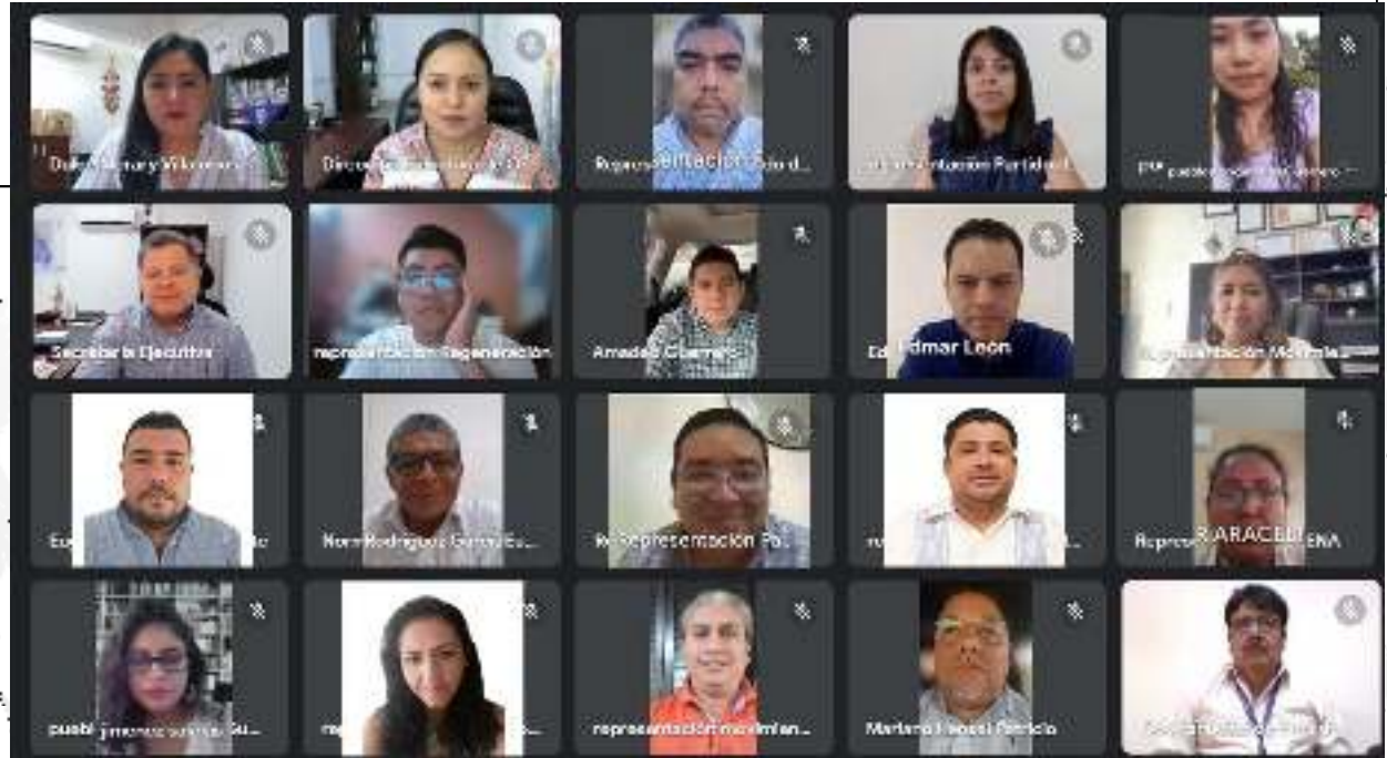
5ª Sesión Ordinaria de la Comisión de Organización Electoral de fecha 11 de diciembre del 2023