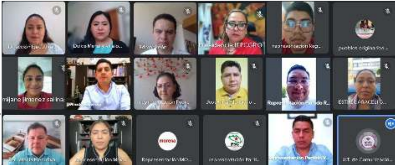
3ª Sesión Extraordinaria de la Comisión de Organización Electoral de fecha 03 de noviembre del 2023