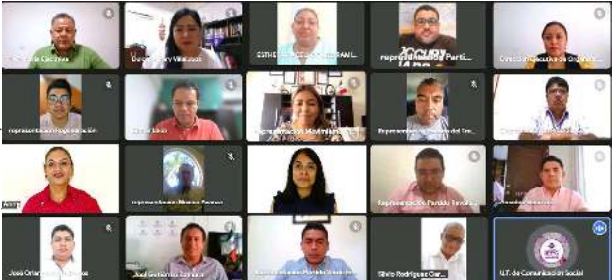
2ª Sesión Ordinaria de la Comisión de Organización Electoral de fecha 27 de septiembre del 2023