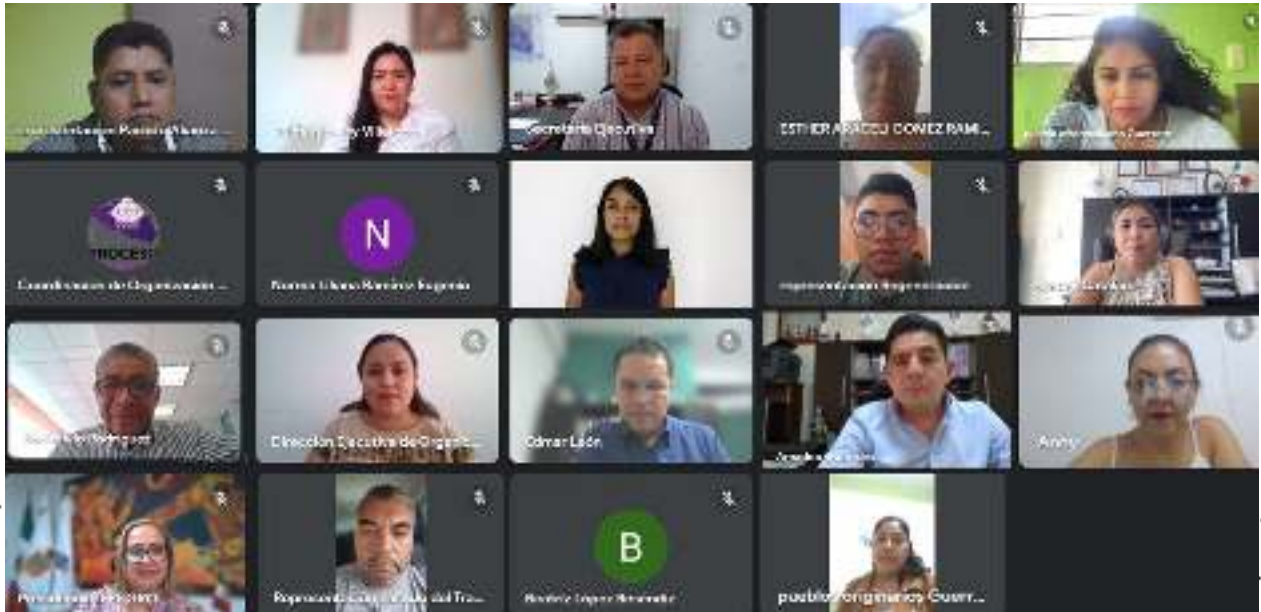
3ª Sesión Ordinaria de la Comisión de Organización Electoral de fecha 23 de octubre del 2023