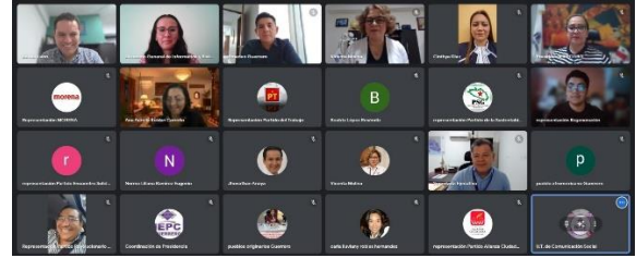
6ª Sesión Ordinaria / 7-12-2023