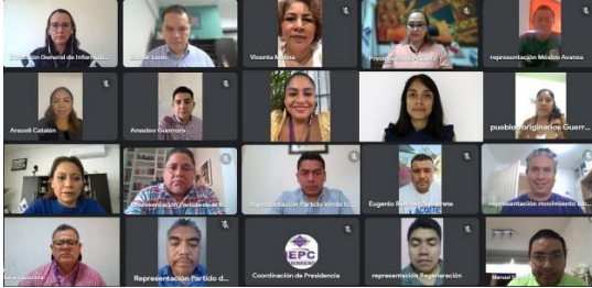
5ª Sesión Ordinaria / 29-11-2023