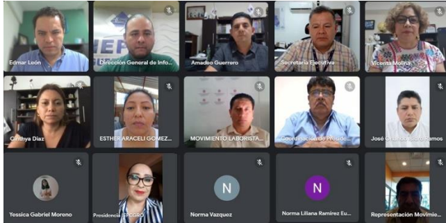
1ª Sesión Ordinaria / 19-07-2023