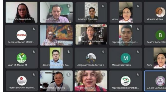
2ª Sesión Ordinaria / 22-08-2023