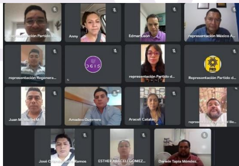
1ª Sesión Extraordinaria / 04-09-2023