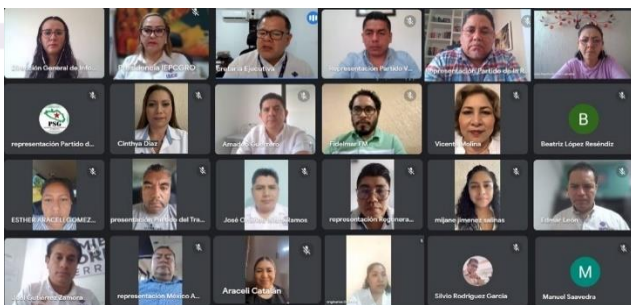
4ª Sesión Ordinaria / 31-10-2023