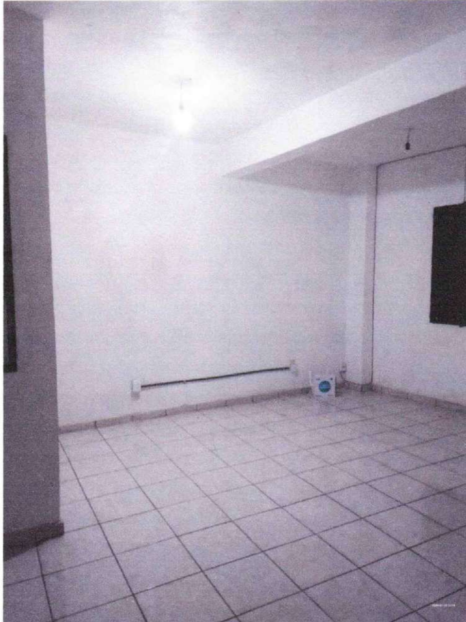
Espacio 3 Primer piso

Se adjunta el anexo fotográfico número 3