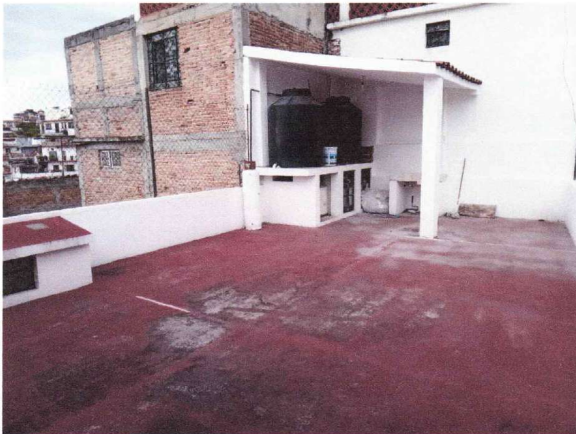
Espacio 4 terraza

Se adjunta el anexo fotográfico número 4