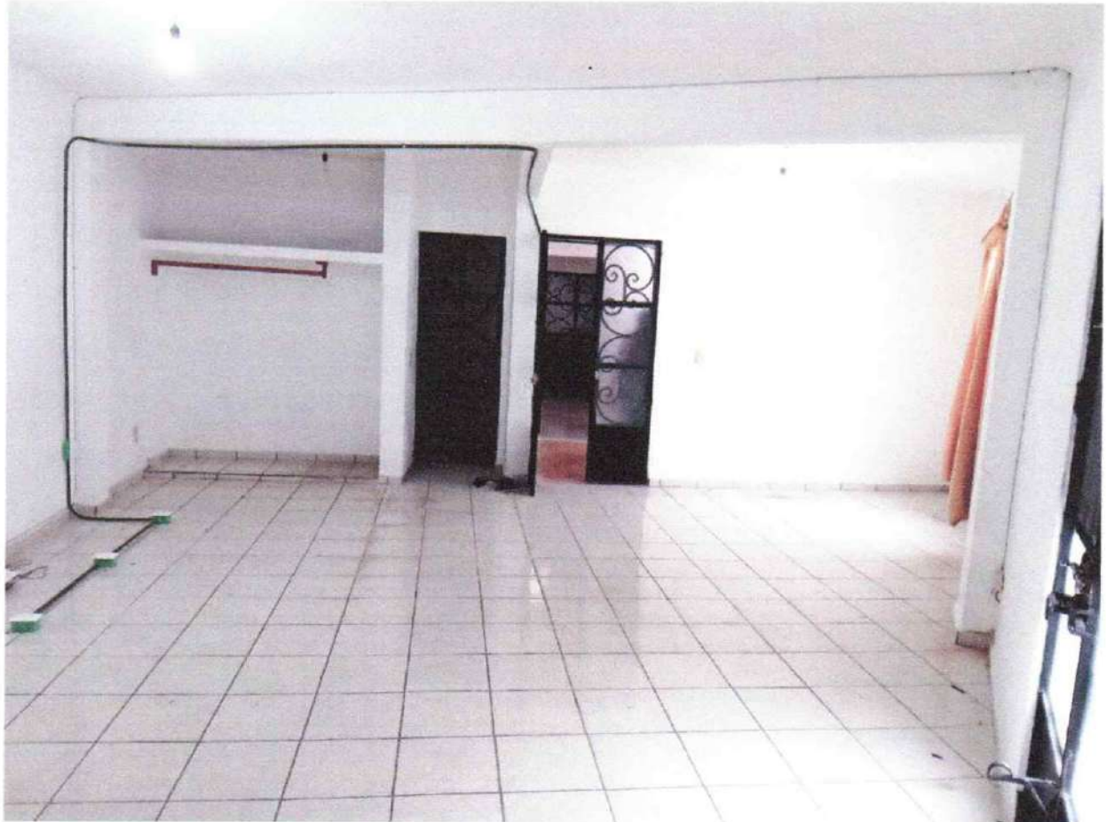
Espacio 2 Primer piso

Se adjunta el anexo fotográfico número 2