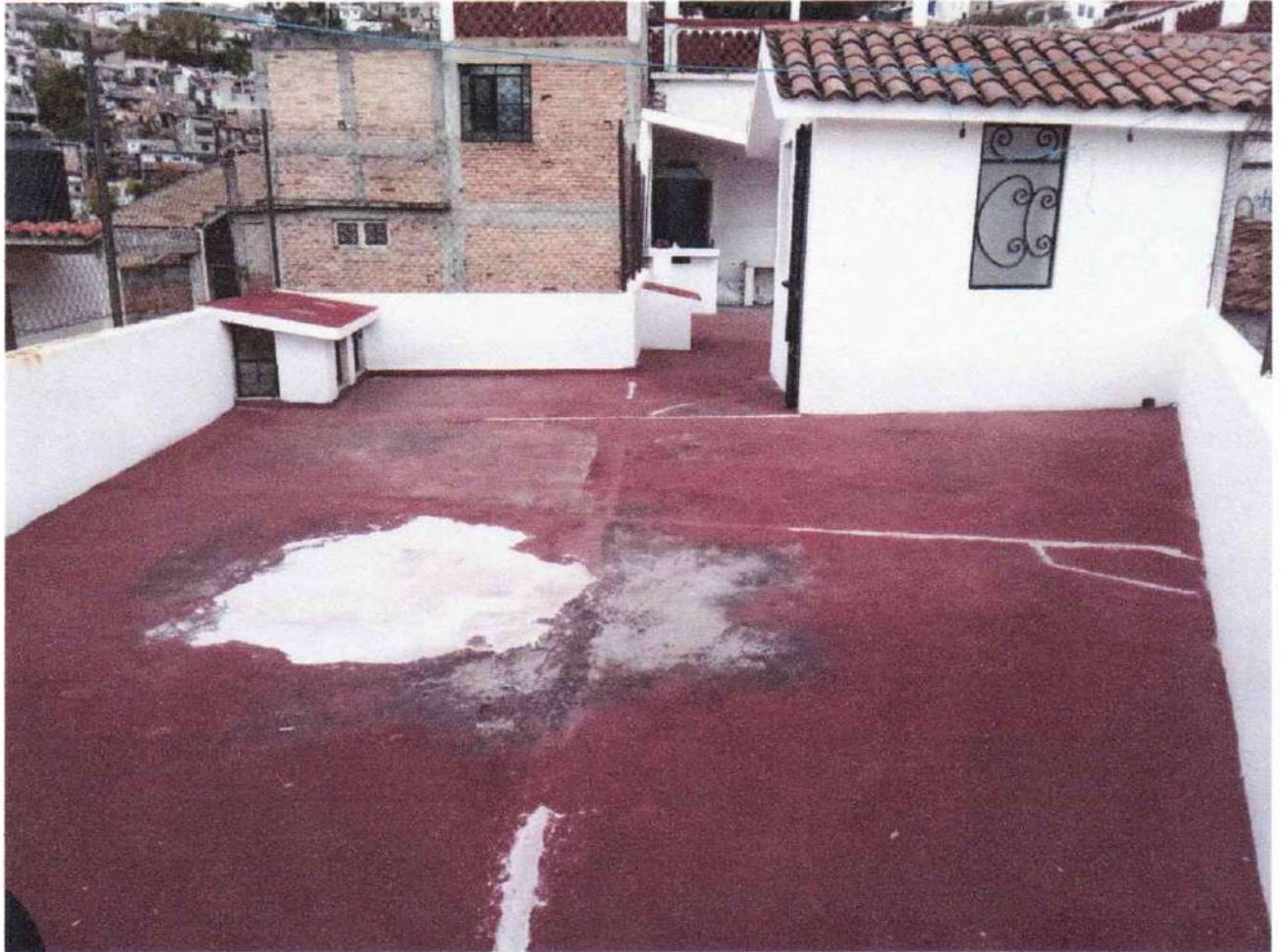
Espacio 5 terraza

Se adjunta el anexo fotográfico número 5