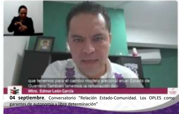
04 septiembre. Conversatorio "Relación Estado-Comunidad. Los OPLES como garantes de autonomía y libre determinación"