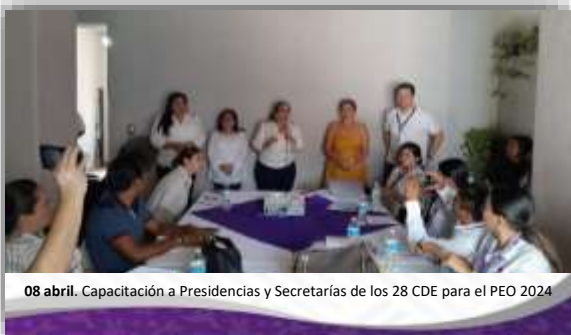
08 abril. Capacitación a Presidencias y Secretarías de los 28 CDE para el PEO 2024