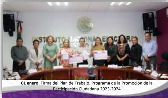
01 enero. Firma del Plan de Trabajo. Programa de la Promoción de la Participación Ciudadana 2023-2024