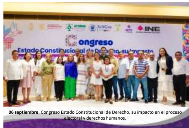
06 septiembre. Congreso Estado Constitucional de Derecho, su impacto en el proceso electoral y derechos humanos.