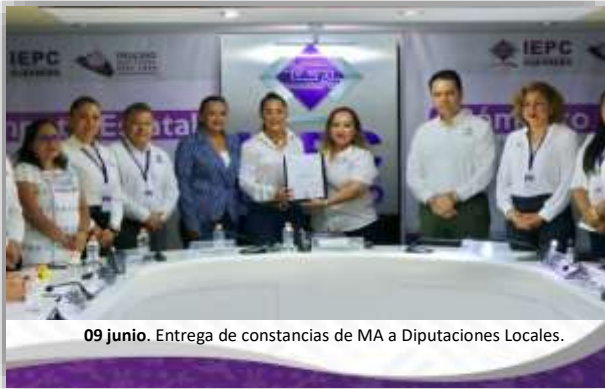
09 junio. Entrega de constancias de MA a Diputaciones Locales.