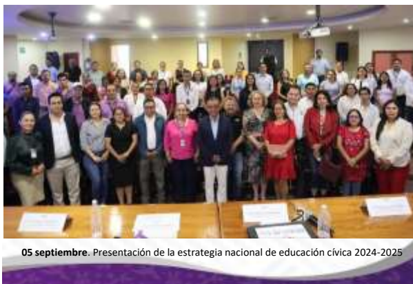
05 septiembre. Presentación de la estrategia nacional de educación cívica 2024-2025