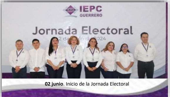
02 junio. Inicio de la Jornada Electoral