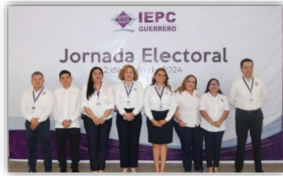
Jornada Electoral el 02 de junio de 2024.