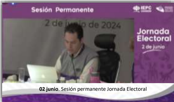
02 junio. Sesión permanente Jornada Electoral