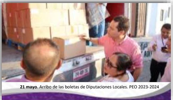
21 mayo. Arribo de las boletas de Diputaciones Locales. PEO 2023-2024