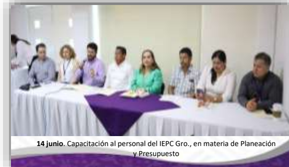
14 junio. Capacitación al personal del IEPC Gro., en materia de Planeación y Presupuesto