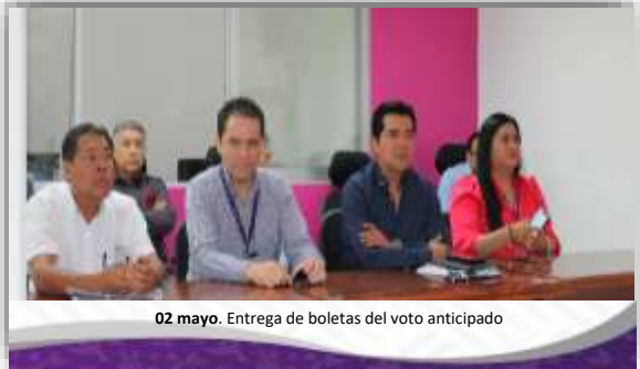
02 mayo. Entrega de boletas del voto anticipado