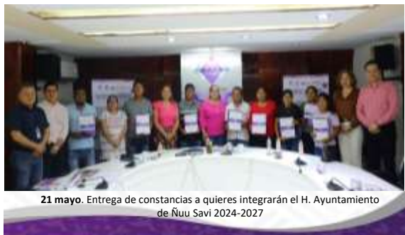
21 mayo. Entrega de constancias a quienes integrarán el H. Ayuntamiento de Nuu Savi 2024-2027