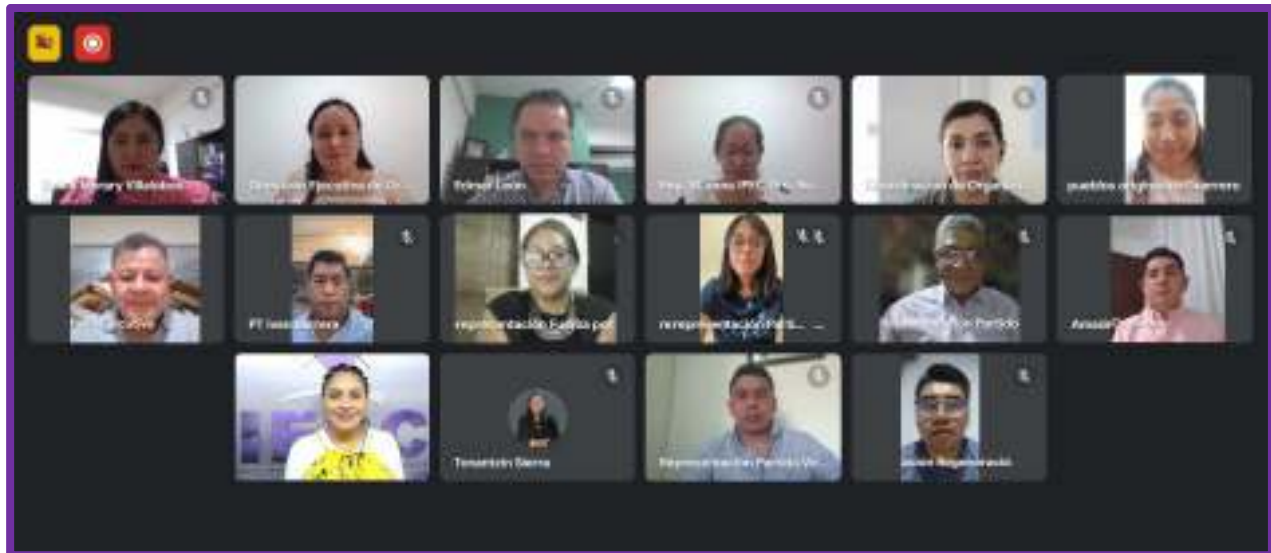
Tercera Sesión Extraordinaria