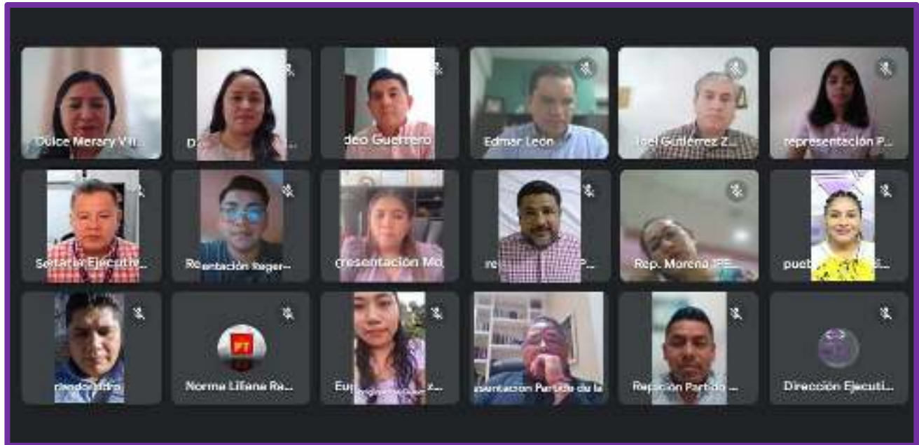
Segunda Sesión Ordinaria