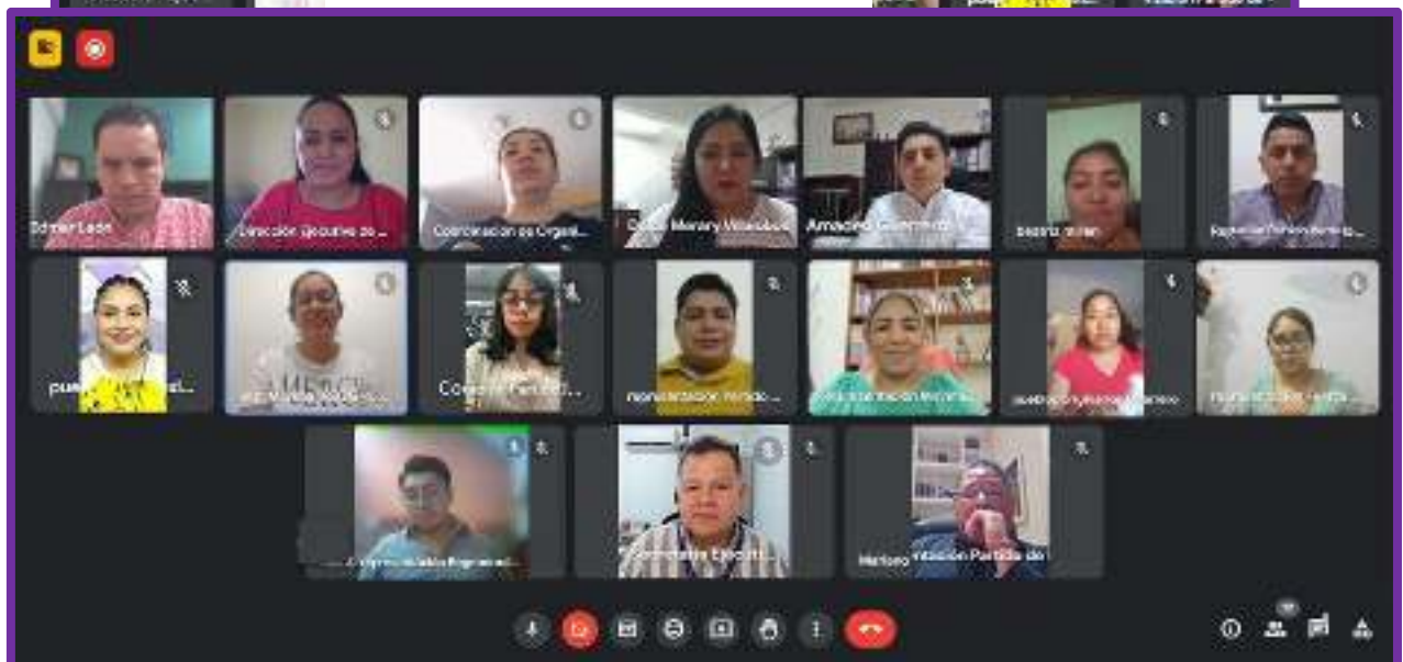
Segunda Sesión Extraordinaria