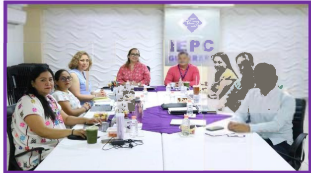
Reunión de Consejeras y Consejeros Electorales del IEPC Guerrero