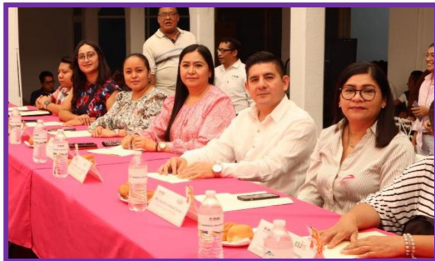
Conferencia de Prensa relativa a la Consulta Infantil y Juvenil 2024.