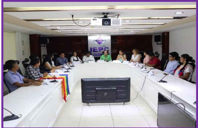
Debate Juvenil: "Somos más las Juventudes de Ahora"