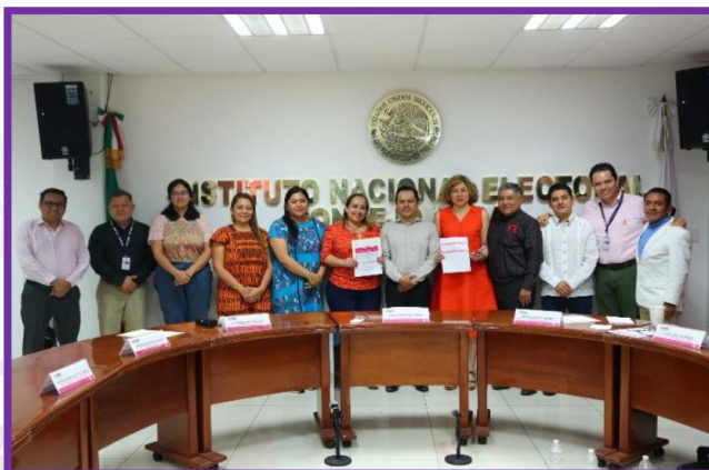
Entrega de la lista nominal de electores solicitada por diversos partidos políticos locales.