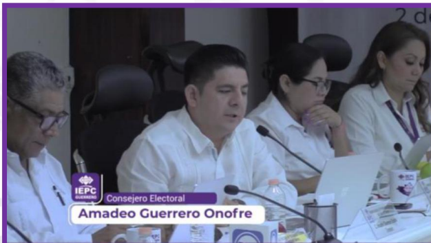
Sesión permanente del Consejo General del IEPC Guerrero