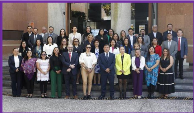
Encuentro Regional de Institutos, Tribunales Electorales e INE 2024.