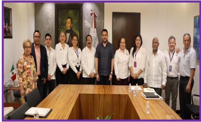
Firma de Convenio de Colaboración institucional entre la Secretaría General de Gobierno, Poder Judicial del Estado y el IEPC Guerrero.