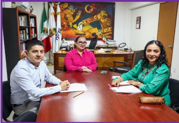
Reunión de trabajo con la Consejera Presidenta e integrante de Grupo ACA