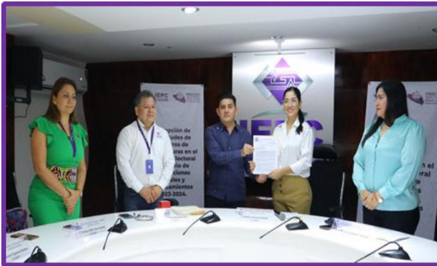
Registro de candidaturas a Diputaciones Locales por el Partido Encuentro Solidario Guerrero.