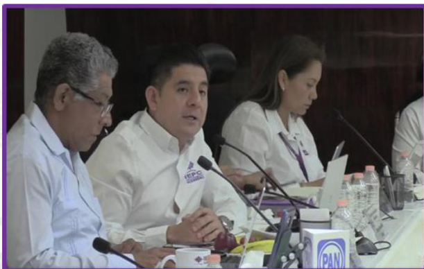
Tercera Sesión Ordinaria del Consejo General del IEPC Guerrero