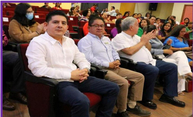
Presentación de Estadística de Participación Política de las Mujeres.