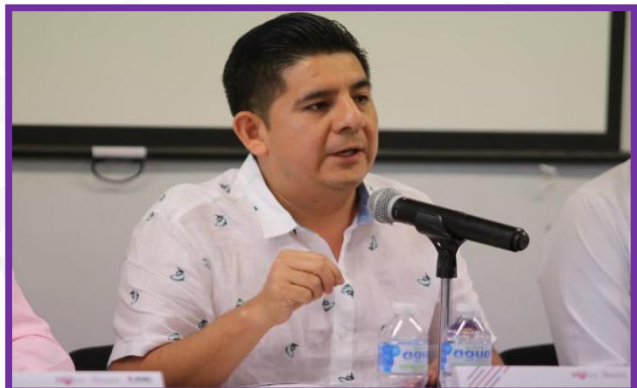
Participación en el Debate Juvenil: Las plataformas electorales de los Partidos Políticos Nacionales y Locales en el Estado de Guerrero.