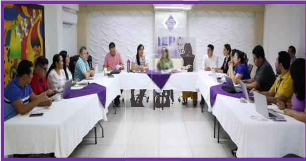
Reunión de trabajo con personal operativo del IEPC Guerrero.