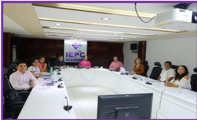
Reunión de trabajo de Consejeras y Consejeros Electorales del IEPC Guerrero.