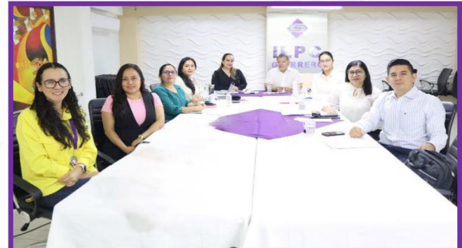
Reunión de Consejeras y Consejero Electorales del IEPC Guerrero.