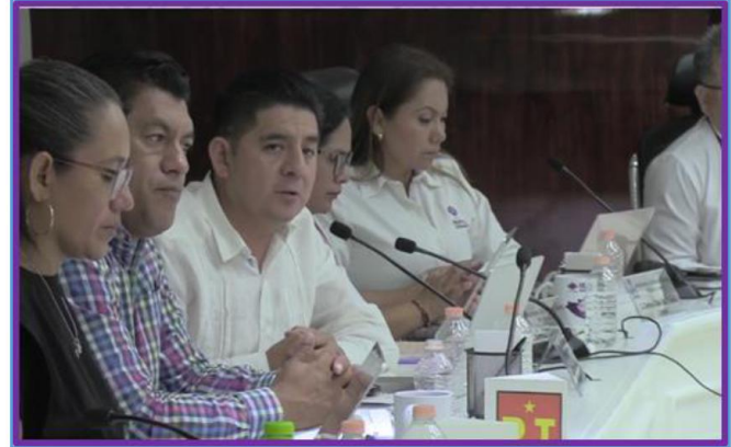
Sesión Especial del Consejo General del IEPC Guerrero, aprobación de candidaturas de Diputaciones Locales en el Proceso Electoral 2023-2024.