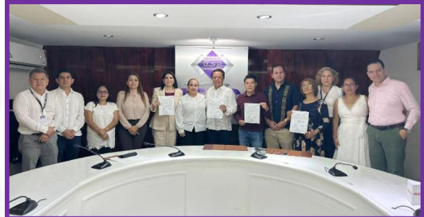
Entrega de constancias de Representación Proporcional a las candidaturas electas del partido MORENA.