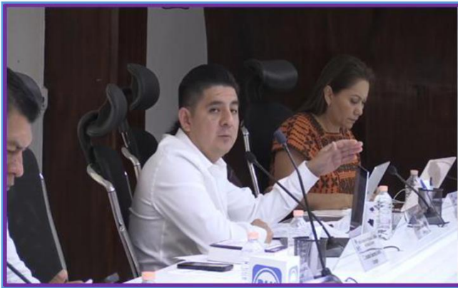
Primera Sesión Ordinaria del Consejo General del IEPC Guerrero