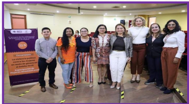
Conversatorio: Experiencias de Mujeres Afromexicanas.