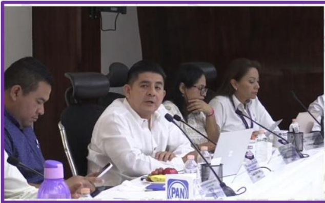
Segunda Sesión Ordinaria del Consejo General del IEPC Guerrero.