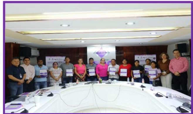
Entrega de constancias a las personas designadas por asamblea municipal comunitaria