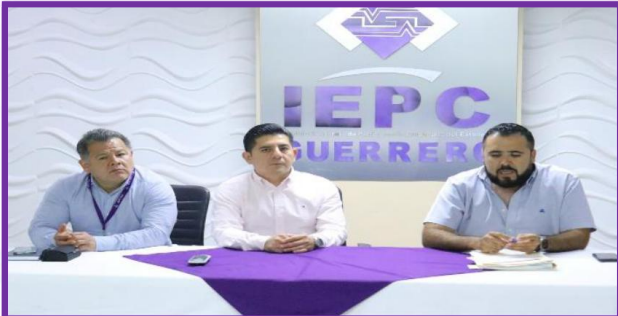
Reunión de trabajo con el Presidente de la Dirección Estatal Ejecutiva del Partido de la Revolución Democrática (PRD) en Guerrero