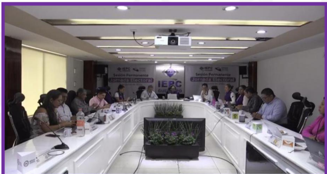
Sesión del Consejo General para dar seguimiento a los cómputos distritales.