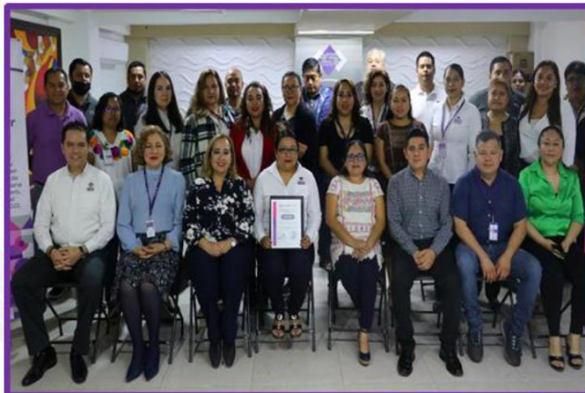
Premiación en la evaluación del desempeño trianual del Servicio Profesional Electoral Nacional, correspondiente al ejercicio valorado 2022.