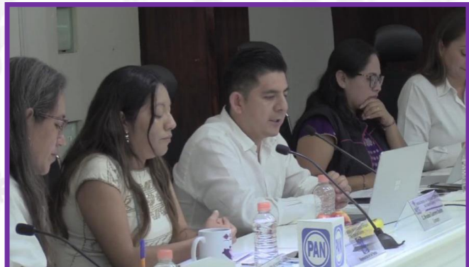
Novena Sesión Ordinaria del Consejo General de IEPC Guerrero.