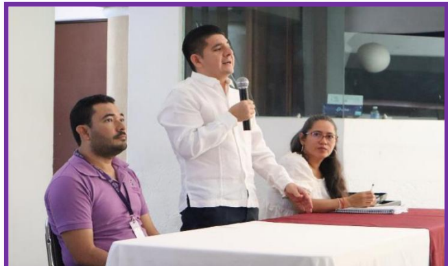
Capacitación relativa al registro de candidaturas a petición del partido político MORENA.