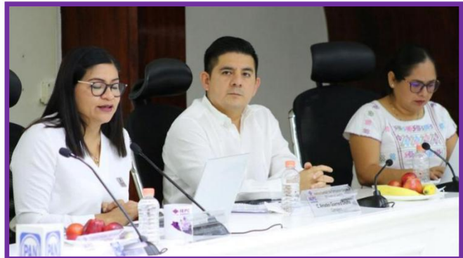
Décima Sesión Ordinaria del Consejo General del IEPC Guerrero