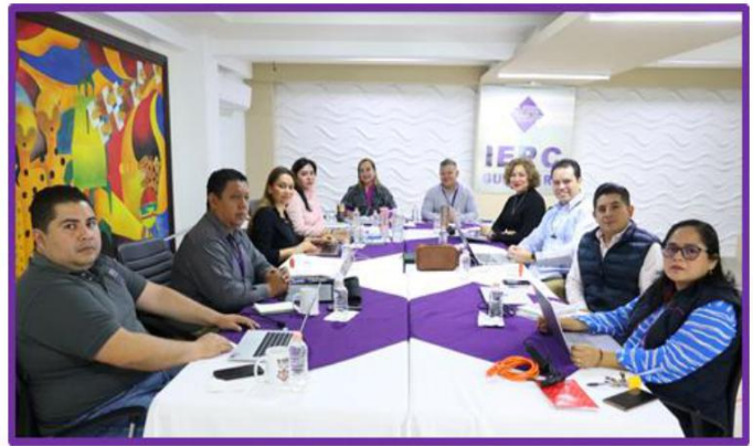
Reunión de Consejeras y Consejeros Electorales del IEPC Guerrero