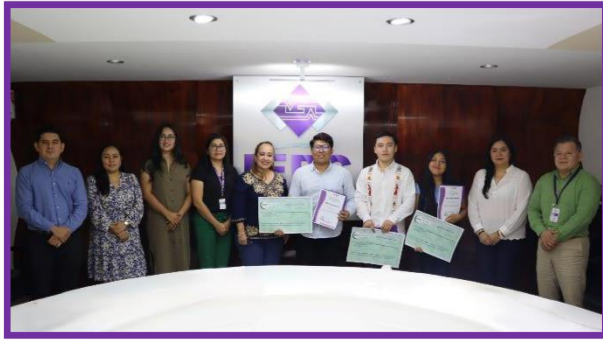
Premiación de las y los ganadores del Concurso de Oratoria 2024.