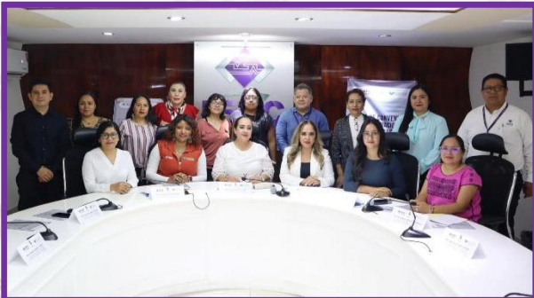
Firma de Convenio entre el IEPC Guerrero, Comisión de Derechos Humanos y la Red de Mujeres, Desarrollo, Justicia y Paz, A.C.