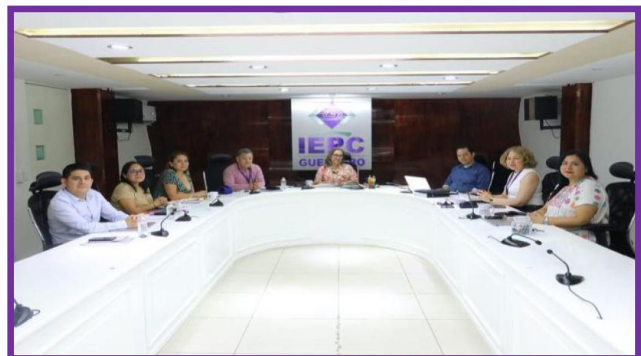
Reunión de trabajo de Consejeras y Consejeros Electorales del IEPC Guerrero