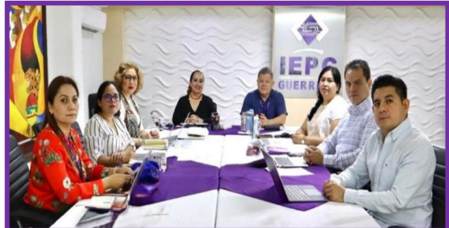
Reunión de Consejeras y Consejeros Electorales del IEPC Guerrero