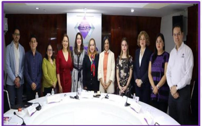
Reunion de trabajo con Consejeras Electorales del Instituto Nacional Electoral.