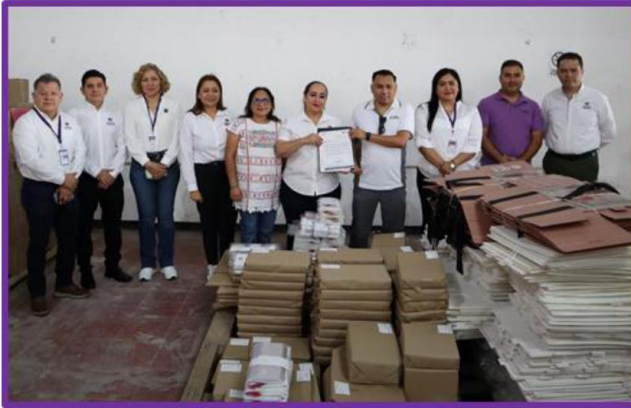
Coordinación entre el INE y el IEPC Guerrero, en la organización del material electoral a utilizarse en el Proceso Electoral Ordinario 2023-2024.