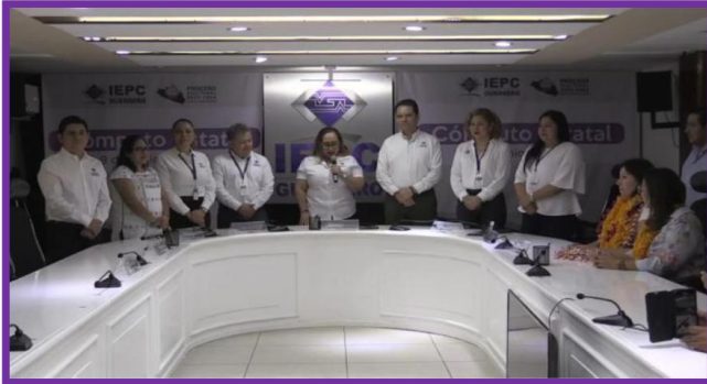
Entrega de constancias de Diputaciones de Representación Proporcional.