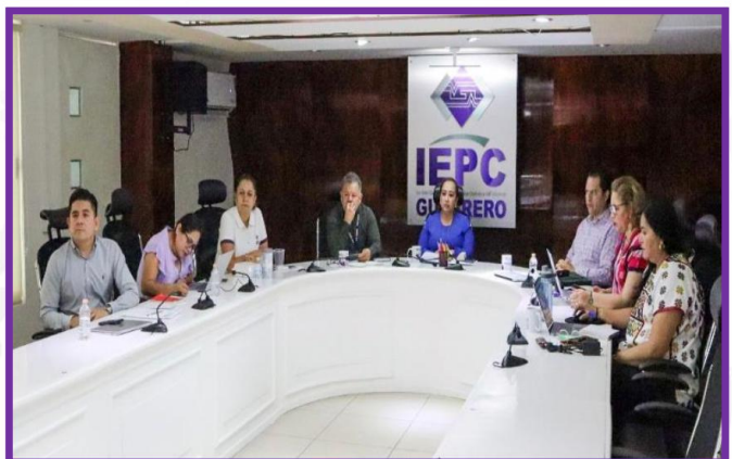
Reunión de trabajo de Consejeras y Consejeros Electorales del IEPC Guerrero.