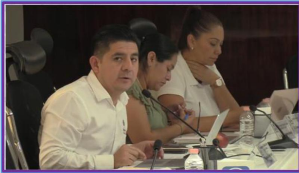
Sesión Especial del Consejo General del IEPC Guerrero, aprobación de registros de Ayuntamientos.