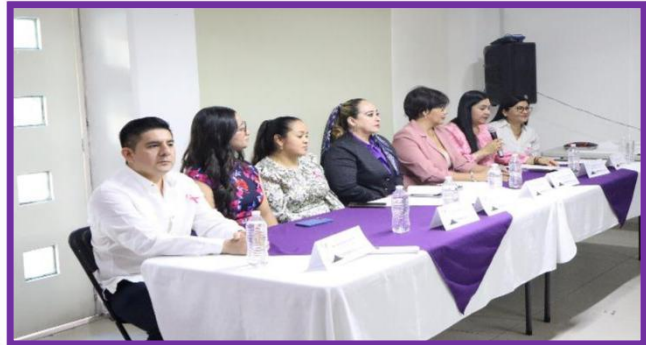
Conferencia con motivo del Día del Cáncer de Mama