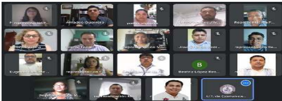
Tercera Sesión Ordinaria (21-03-2024)