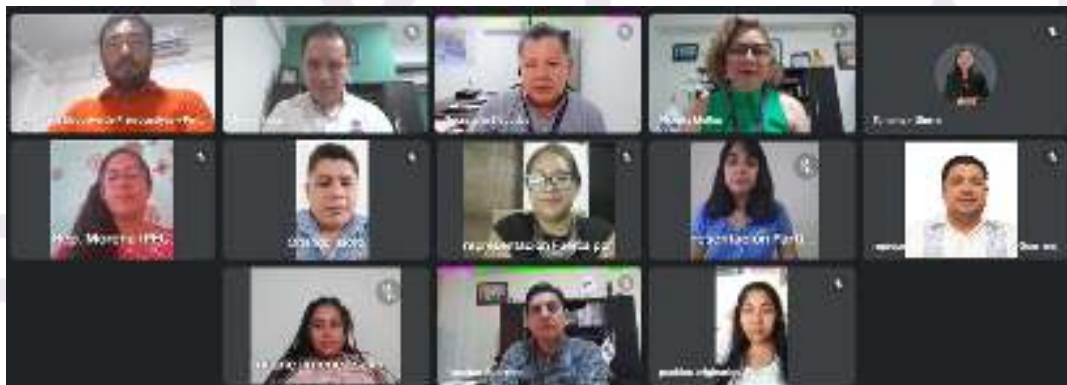
Quinta Sesión Ordinaria (22-05-2024).