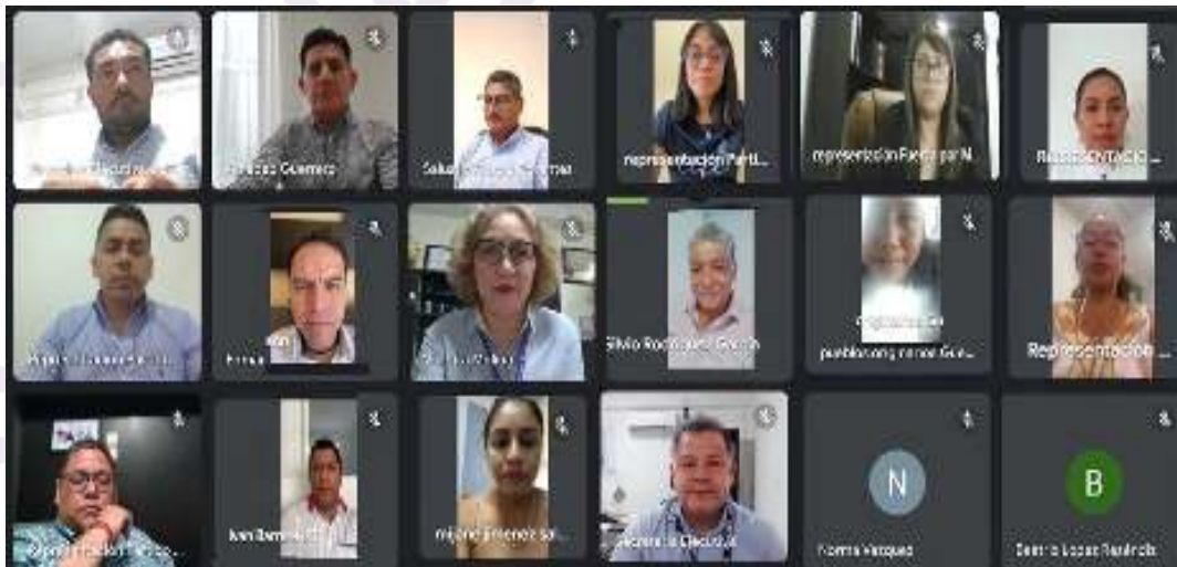
Décima Sesión Ordinaria (25-10-2024).