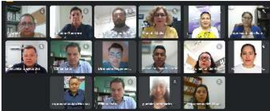
Novena Sesión Ordinaria (19-09-2024).