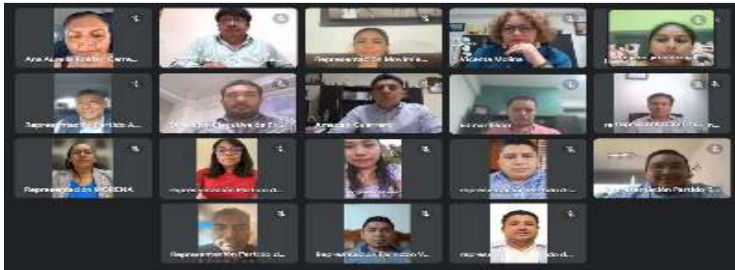
Segunda Sesión Ordinaria (16-02-2024).