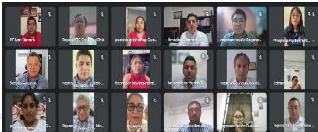
Cuarta Sesión Ordinaria (17-04-2024).