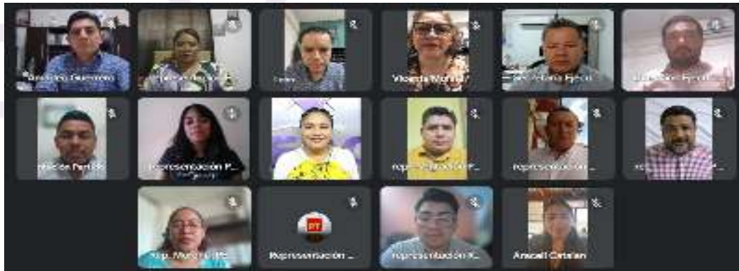
Tercera Sesión Extraordinaria (27-02-2024)