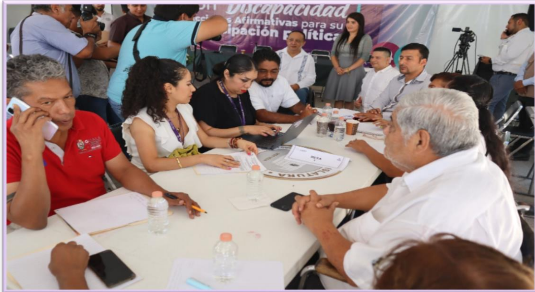
Grupo de trabajo 1