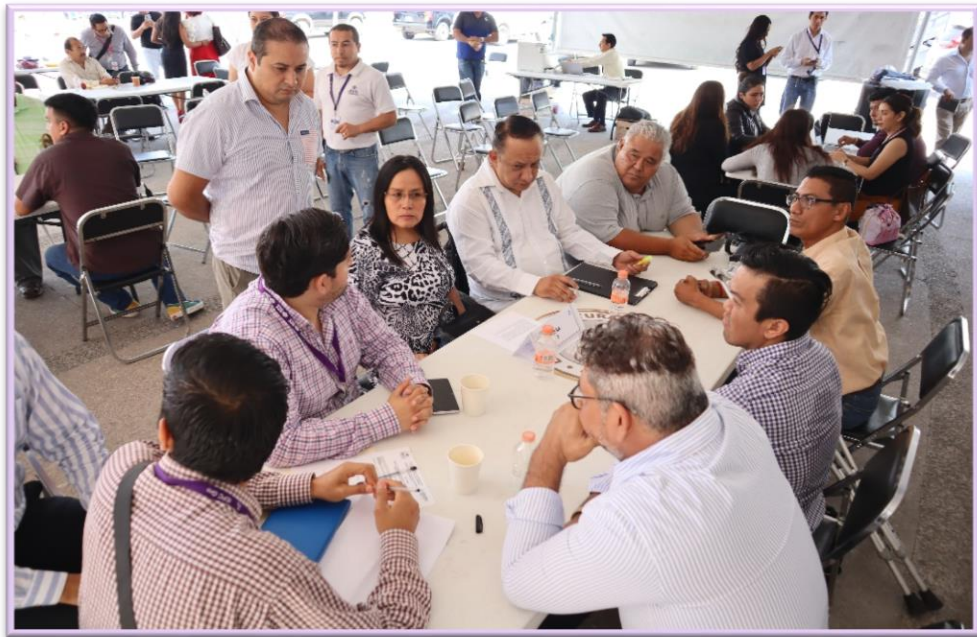
Grupo de trabajo 5