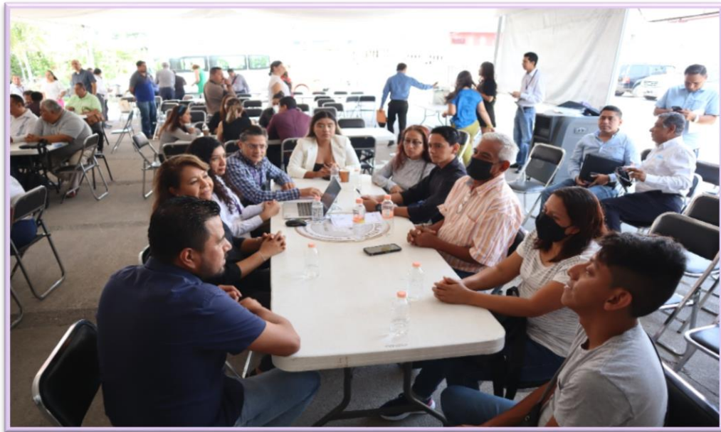
Grupo de trabajo 3