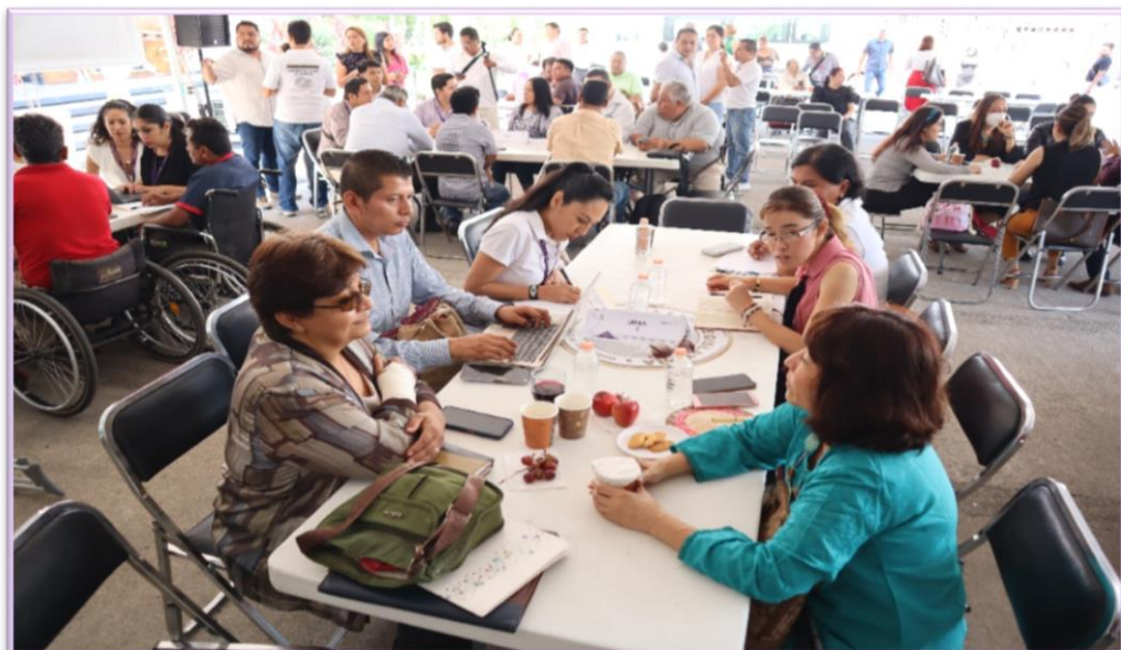
Grupo de trabajo 2